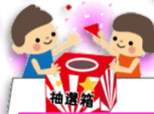
抽選箱 五小 1月19日 だかし屋