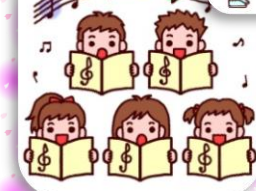
牟礼神明社秋の木祭 ボランティア 三中吹奏部・五小・ 高山小ふれあい広場