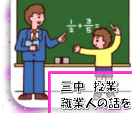
三中 授業 職業人の話を聞く会