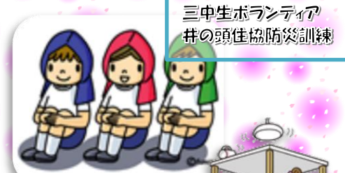
三中生ボランティア 井の頭佳協防災訓練

三鷹の森学園が開園してから5年。子どもたちを中心に学校、地域、保護者のつながりが太く、強くなってきているのを感じます。このつながりを大切にして、さらに太く、強く、そして広くつながっていきますように…今年度も三鷹の森学園の子どもたちに豊かな経験の機会を与えてくださって、ありがとうございました。