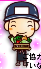
ご協力「サミット」、 「いなげや」さん。