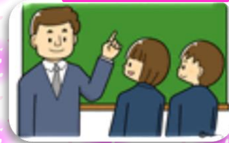
三中 高校教諭訪問授業