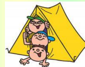
五小オヤジの会 防災キャンプ (7/20・21)