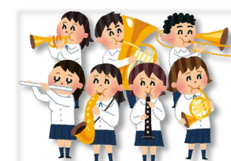
サマーコンサート (8/23)