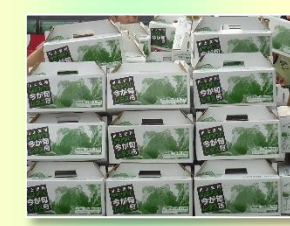
五小・高山小自然教室 八ヶ岳川上村 (6/25～28)