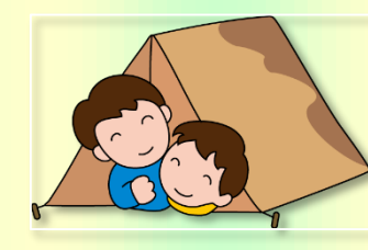
高山小父親の会 防災キャンプ (7/13・14)