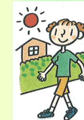
高山地区青少対 早朝歩く会 (7/21)