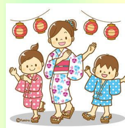
三鷹台盆踊り 五小ソーラン (8/3・4)

子どもが地域のなかで、人と関わりながら自分自身や仲間の大切さ、井の頭のよさを感じることが出来る貴重な経験です。