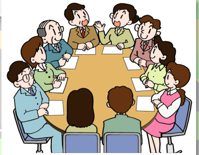
第1回CS委員会の様子