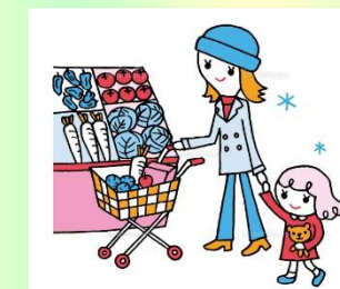
いなげや・サミット 高山小 川上村レタス販売 (8/25・26)