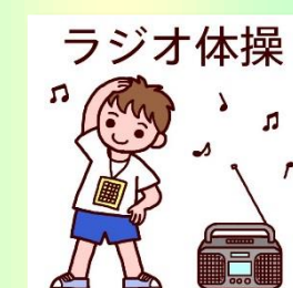
五地区青少対 夏休みラジオ体操 (8/29～9/2)