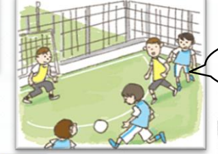
五小校庭開放世話人