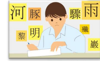
漢検CSボランティア