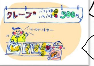
五地区青少対 三中ボランティアと 一緒に五小まつり参加