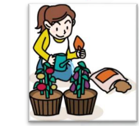
花いっぱい運動 保護者ボランティア