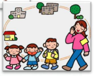
高山小4年生地域清掃 保護者ボランティア