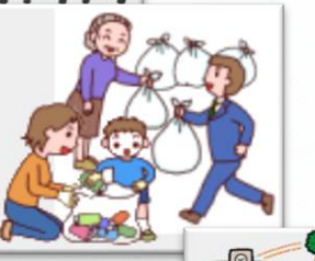
井の頭公園にて井の頭町会 と一緒に五小全校清掃活動