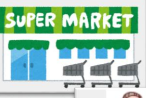
地元スーパーのご協力のもと 高山小レタス販売