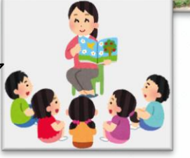
高山小「読み聞か せの会」による 読み聞かせ活動