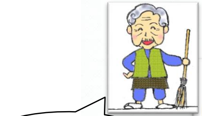
高山地区青少対 竹ぼうきを作り地域へお届け

今はただ重なりあう縁だとしても、いつの日か地域の子供を中心に縁と円が歯車のように動きだすことを願い・・・