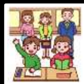
高山小 道徳授業公開

家庭と一体となった道徳教育を進めるため、各校で講演会や保護者と先生との意見交換会などが開かれました。