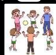
小学生ソフトバレーボール大会