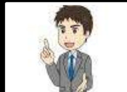
道徳地区公開講座 「五小避難所運営講演会」